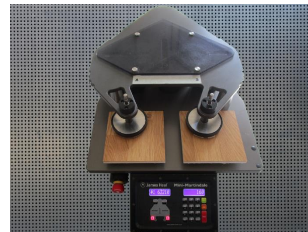
Аппарат для проведения испытаний на истирание (тест Мартиндейла).