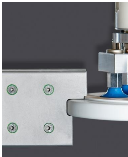
TRANSFERDISC от Schiele Maschinenbau GmbH